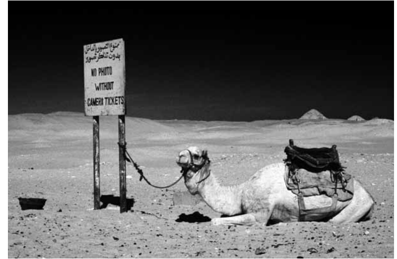
Schnappschuss in Saqqara, Forum-Reise «1° im Quadrat», Februar 2001