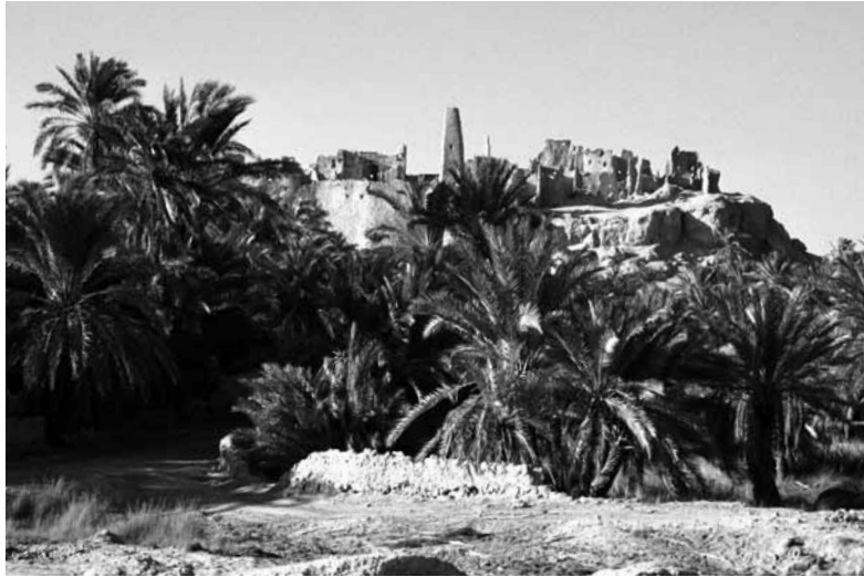
Amuntempel in der Oase Siwa, Forum-Reise «Oasenbogen», Februar 1997